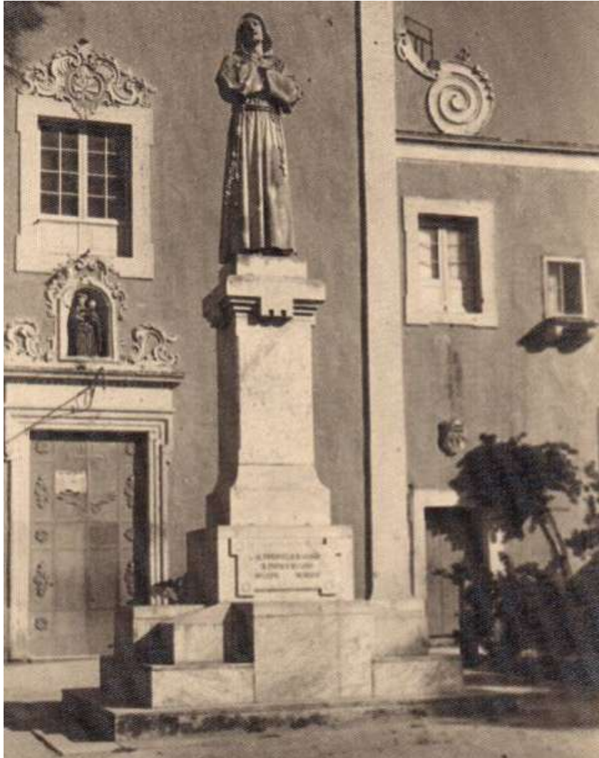
Monumento di san Francesco d'Assisi, 1926

ad attendere la sentenza. Non occorre poi dire che vi è pure la campana piccola, ossia conforme alle nostre leggi e che funziona a pennello. Questa la storia della campana di Campi...».