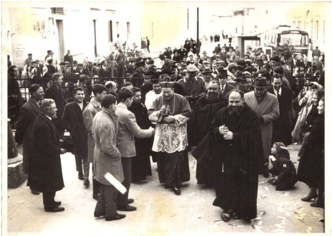
Inaugurazione della parrocchia San Francesco d'Assisi, 1962

Il 29 febbraio 1960 il vescovo di Lecce, mons. Francesco Minerva, dando seguito ai contatti già avviati in tal senso nell'estate del 1959 con i frati cappuccini, al parere favorevole espresso dal Definitorio provinciale dell'Ordine e al nulla osta concesso da quello generale nel gennaio del 1960, richiedeva formalmente al padre provinciale,