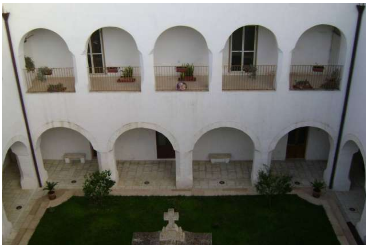
Convento dei cappuccini, chiostro (foto F. Monticchio, 2008)

- 5 luglio: Prima domenica del mese dedicata ai Cordigieri. In questa si fa la chiusura dell'anno sociale e si tengono gli esami-gara di cultura religiosa e francescana. Presenza tutta la giornata il Padre Commissario Provinciale T.O.F. Rev. Padre Clemente da Triggiano .