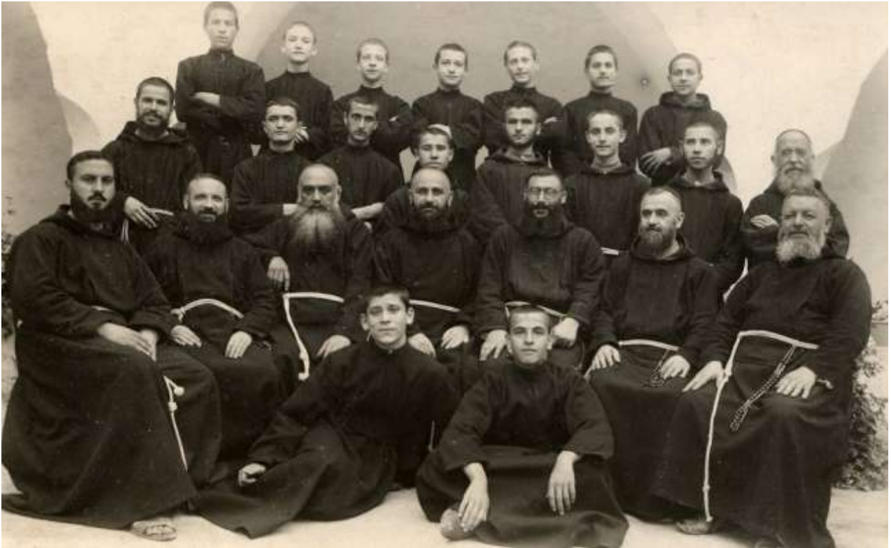
Convento dei cappuccini, chiostro:fratini e studenti del Seminario serafico, 1931