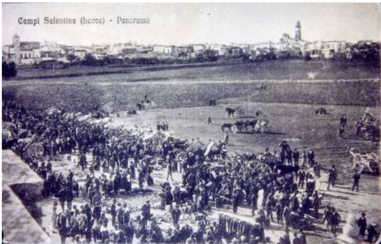
Fiera della Madonna di S. Stefano, anni 1920 –1930

un Santo o una reliquia insigne. (...) si potrebbe inviare “una reliquia visibile”, posta in un bel reliquiario, in modo che possa essere portata anche in processione».