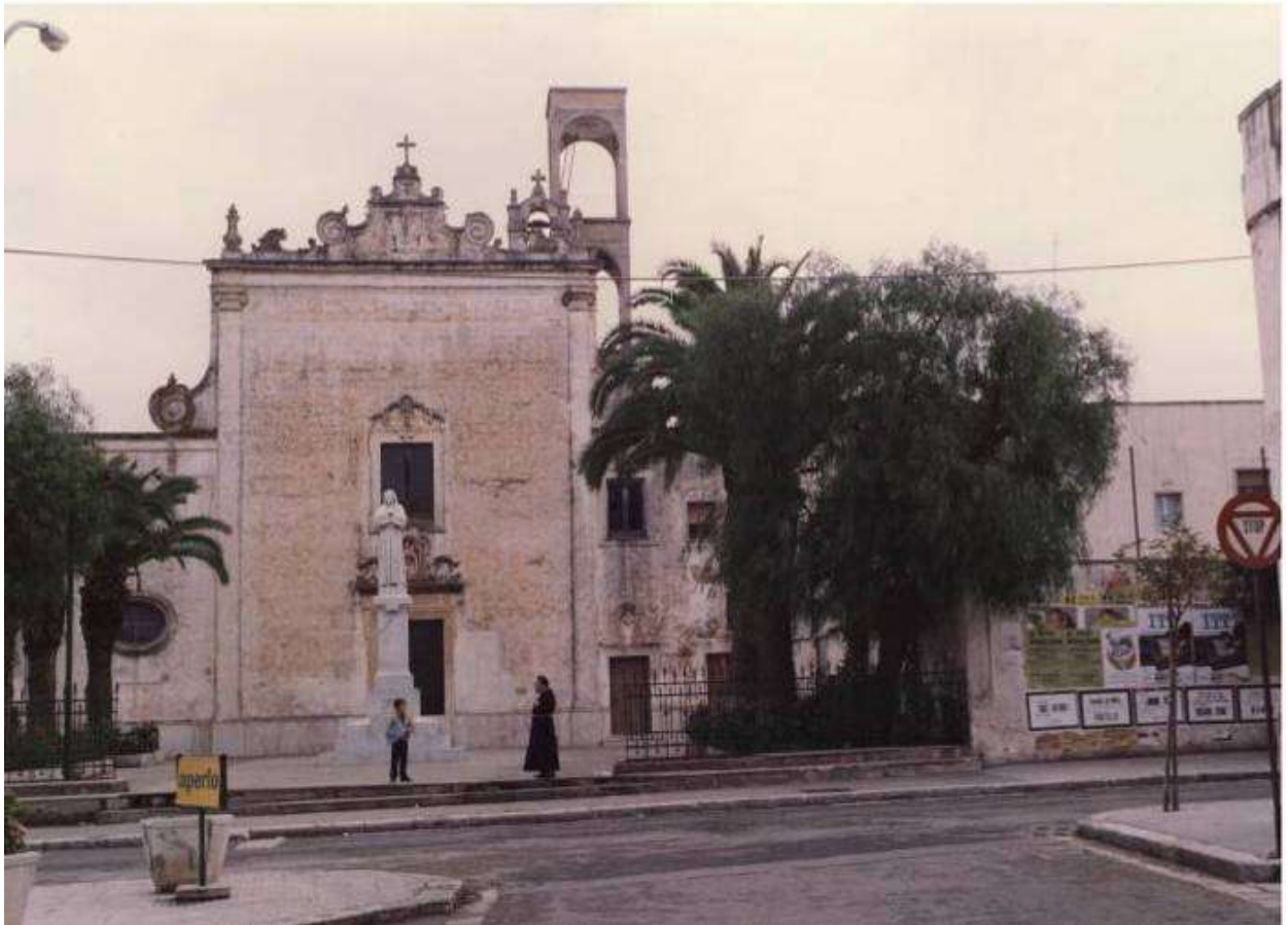
Facciata della chiesa dei cappuccini con il campanile costruito nel 1968

L'11 febbraio 1962 il vescovo decretava l'erezione della nuova parrocchia sotto il titolo di S. Francesco d'Assisi, affidandola ai frati cappuccini e definendone, il giorno successivo, i confini: