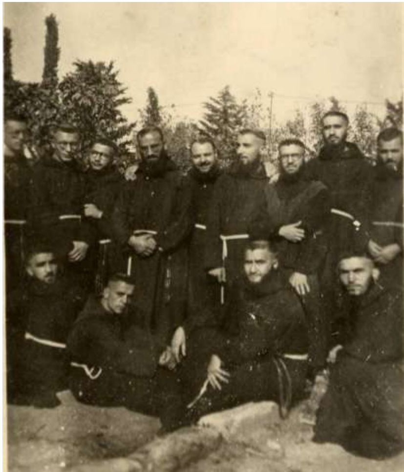
Agro di Trepuzzi. Studenti in visita al convento di S. Elia. 1941

«Ecco la storia della famosa campana per la quale mi ha fatto scrivere dal suo segretario. Durante l'anno centenario francescano il Comitato per le feste promosse l'erezione di un monumento al Serafico Padre, e fu eretto nella piazzetta del convento. Il III Ordine, però, pur cooperando il Comitato suddetto, si rese modo speciali promotore di una campana da porsi sulla nostra chiesa. Dominati presi più dall'affetto che da altro i Terziari non pensarono a mettersi d'accordo con le leggi nostre, e la campana riuscì del peso più che tre volte di quello indicato dalla nostre Costituzioni, per quel che riguarda il peso delle nostre campane. Si aggiunga che il superiore locale non pensò o non credè, per la solenne circostanza, doveroso riferire e interpellare al riguardo, il p. provinciale del tempo, p. Bernardino da Rutigliano.