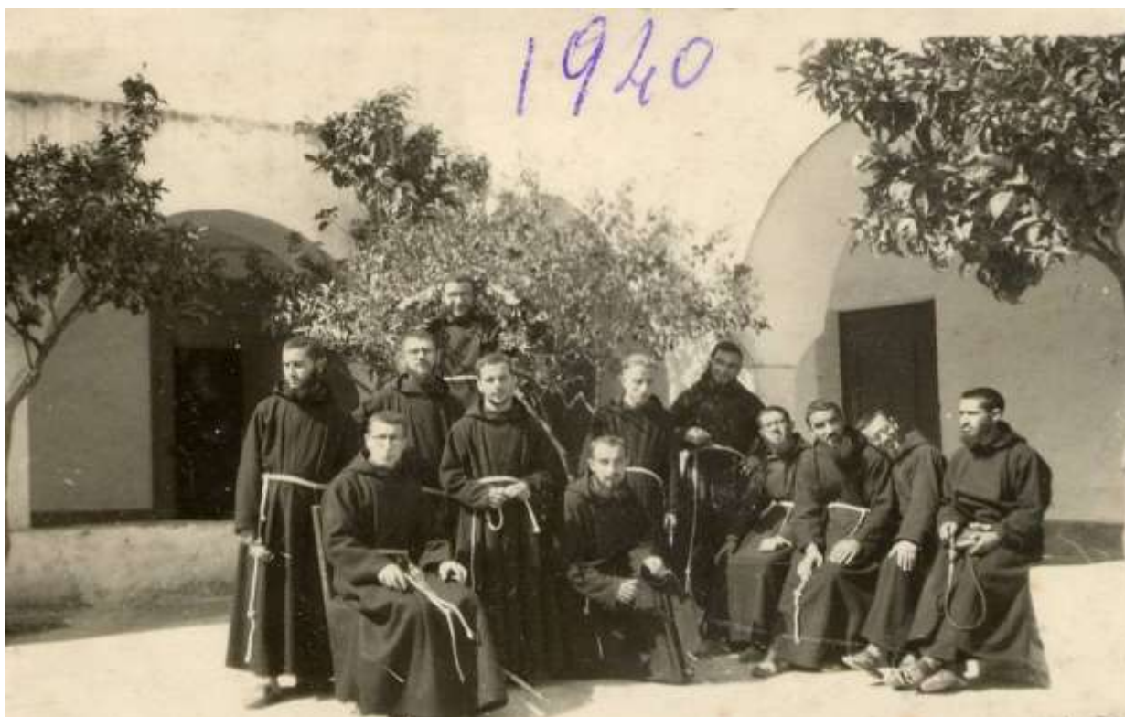
Convento dei cappuccini, gruppo di studenti nel chiostro, 1940

« Questo convento, dopo mille peripezie, come risulta dalle memorie scritte, venne finalmente comperato ad enfiteusi perpetua. Il lunghissimo uso che di