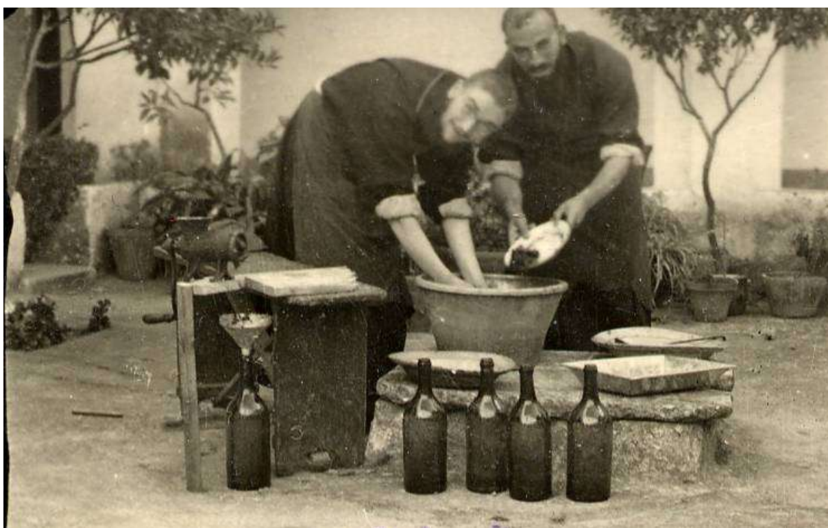
Convento dei cappuccini, chiostro: preparazione della salsa, 1940

- 16 luglio: gli studenti accompagnati dal Padre Direttore Agostino da Triggiano partono per Scorrano per ivi compiere gli studi teologici. Qui sono stati destinati