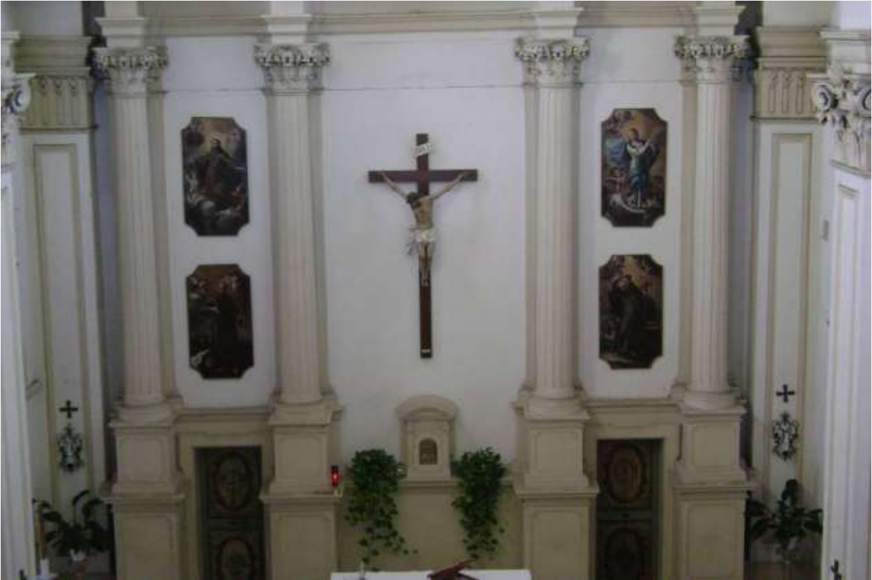
Chiesa dei cappuccini, interno