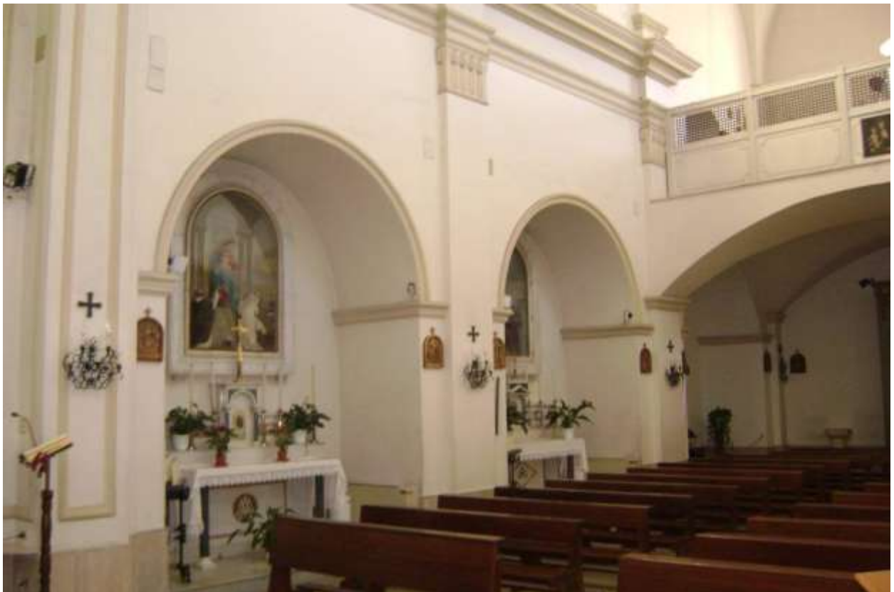
Campi S.na. Chiesa dei cappuccini, nicchie laterali

- 13-30 giugno: prosegue il "Mese al S. Cuore", predicato con efficace zelo dal