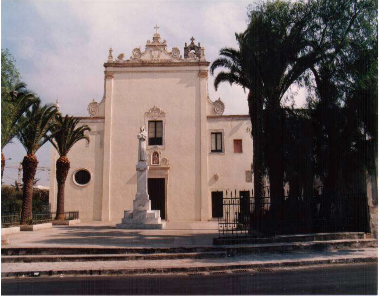
Chiesa dei cappuccini, dopo l'abbattimento del campanile, 1988

raggiungere Piazza Mercato – prosegue per via Umberto I – poi a destra per Via Puglie – indi a sinistra per viale Nino Palma – a destra per via Occhineri e si prosegue per la strada Diga sino a raggiungere la via per Squinzano