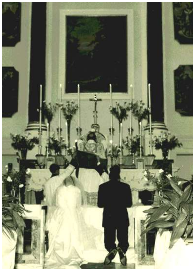
Chiesa dei cappuccini, altare maggiore 1964

Il 6 aprile il ministro generale dei cappuccini, Clemente da Milwaukee autorizzava il ministro provinciale di Puglia a firmare la convenzione con l'ordinario diocesano di Lecce e ad iniziare le necessarie pratiche per l'accettazione della parrocchia.