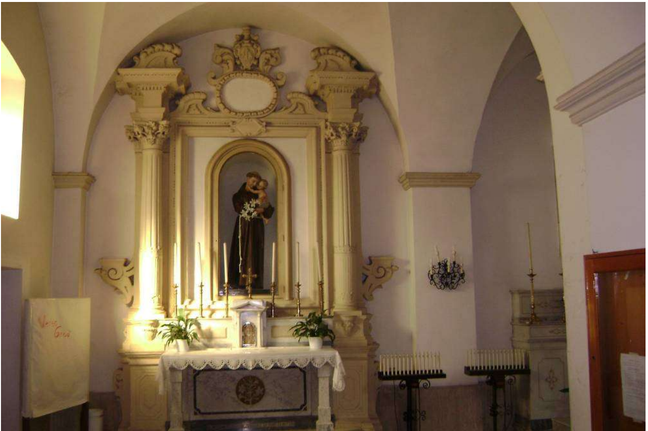
Chiesa dei cappuccini, altare in pietra di S. Antonio (foto F. Monticchio, 2008)