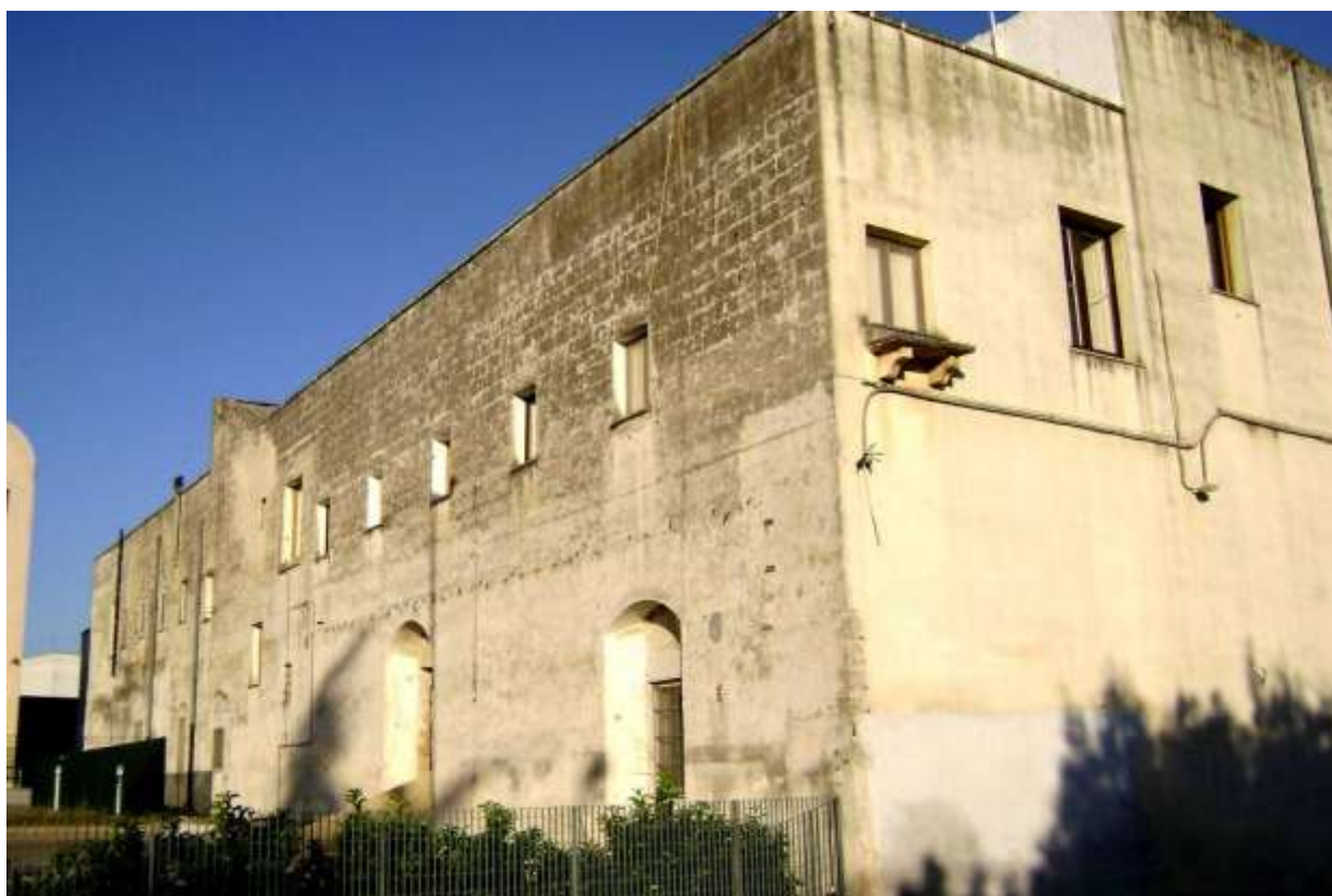
Convento cappuccini, lato via Novoli

La maggiore difficoltà per meglio operare, a nostro parere, è data dall'estensione del territorio parrocchiale e in particolare dalla posizione geografica della zona o rione "Palombaro" (...) un'altra grave difficoltà è stata data dalle condizioni economiche della parrocchia, per cui si è dovuto perdere molto tempo prezioso nel reperire fondi necessari per il restauro della chiesa, della casa religiosa e delle attrezzature ...».